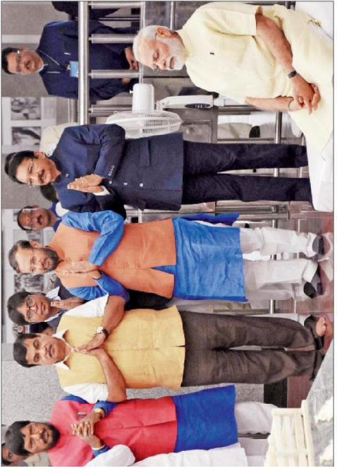
राष्ट्री के नोके पर पीएम मोदी महाराष्ट्र के सीएम और गवर्नर समेत दूसरे मंत्रियों के साथ नागपुर स्थित दीक्षाभूमि गए।

अर्थव्यवस्था में क्रांति आएगी, भीम ऐप के तहत दो नई योजनाएं भी शुरू की